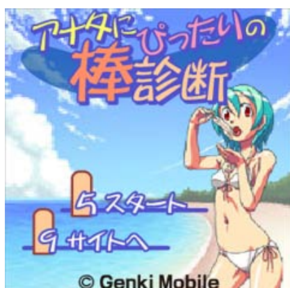
アナタにぴったりの棒診断

当社は今後も幅広いジャンルのゲームを追加し、サイトの更なる認知度アップ、ユーザーの増加を狙います。