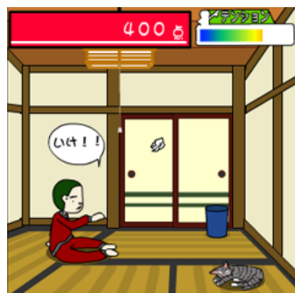
自宅スポーツシリーズ ゴミ箱バスケ☆シュート