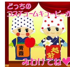
コスチュームキューピー 見分けまSHOW

「りんご娘キューピー(青森)」と「水仙娘キューピー(福井県)」のどちらのコスチュームキューピーが画面に現れたかを当てるゲームです。ゲームを進めるにつれてコスチュームキューピーの動きが早くなるので、反射神経と動体視力が問われます。