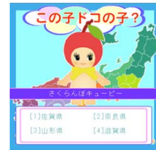
コスチュームキューピー この子ドコの子

様々なコスチュームキューピーが登場し、どこの地域のキャラクターかを当てるゲームです。全6タイトル配信致します。